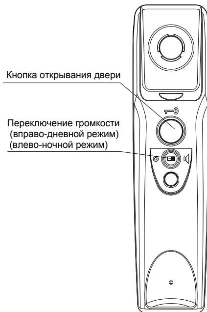
Рис.1 Внешний вид с тыльной стороны трубки

Устройство абонентское изготовлено в виде телефонной трубки с подставкой. Органы управления устройства абонентского А5 показаны на рис. 1.